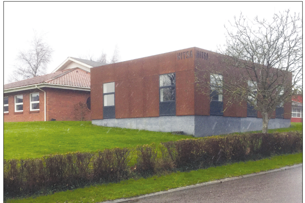
Efter flytningen til Kolding står der blot tomme bygninger tilbage i Hejls.

Den nye virksomhed har i alt cirka 110 medarbejdere i Danmark, Sverige og Let-