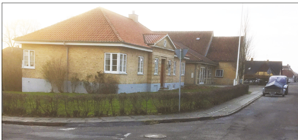
- Og hvis du ikke lige ved det, så har lokalbetjenten domicil i denne bygning på adressen Skolevej 10 i Christiansfeld.