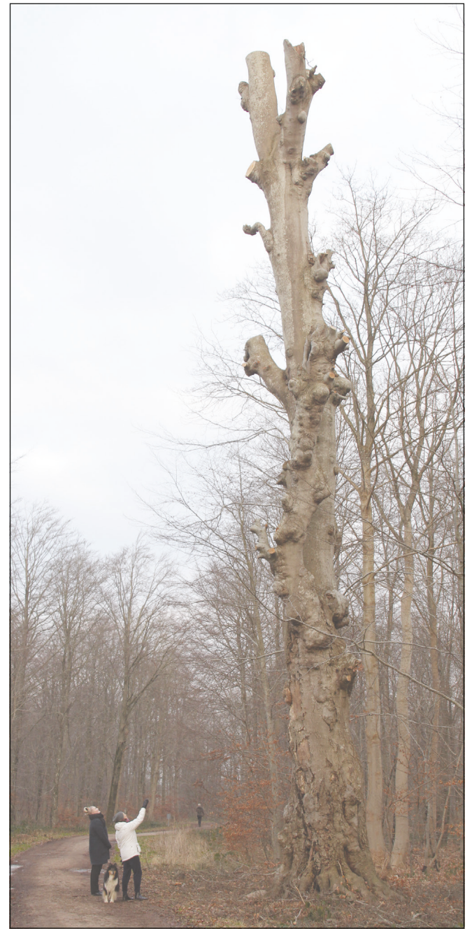
Gamle Heine som den nu ser ud uden grene og sin øverste syge sidestamme.

Denne vinter har forstfolkene i stedet for nøjedes med at kappe træets grene og ladet den sunde stamme stå til glæde for flagermusene. Selv om Gamle Heine nu blot er en skygge af sig selv, er skovens kæmpe dog stadig et imponerende skue - og inde i stammen kan flagermusene fortsætte med at sove deres vinterdvale uden at skulle bekymre sig om fremtiden de første mange år.