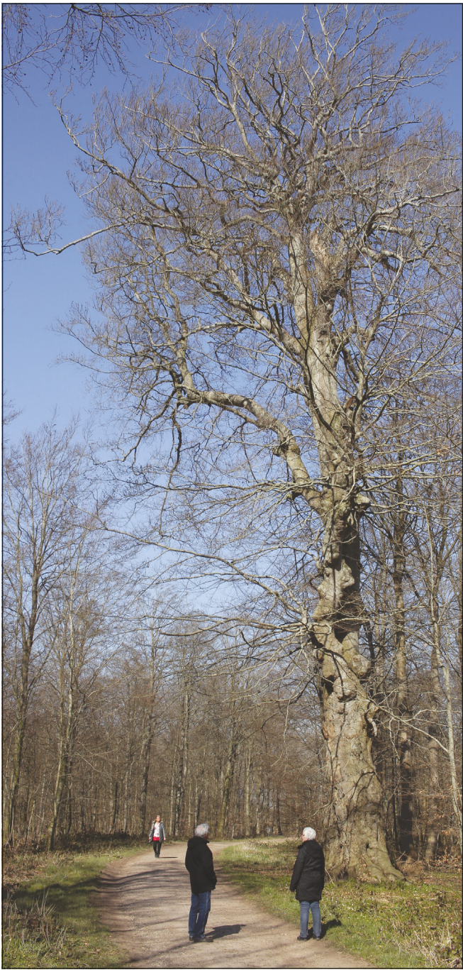
Gamle Heine fotograferet sidste år i april.