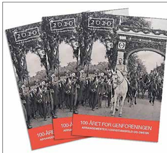
Det samlede program for Genforeningsaktiviteter og -events i Christiansfeld og omegn indeholder mange spændende arrangementer og event. Hent det i Christiansfeld Centret.

Se også alle de landsdækkende aktiviteter på www.genforeningen2020.dk