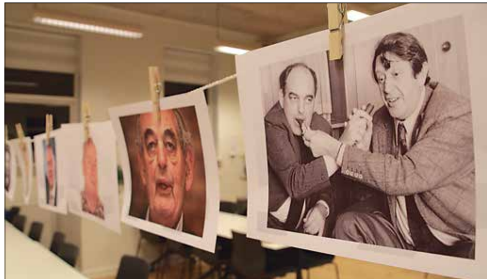
Fotos af de mange politikere hængt til tørre i Seniorhuset, som vi lærte lidt at kende fra deres private sider.