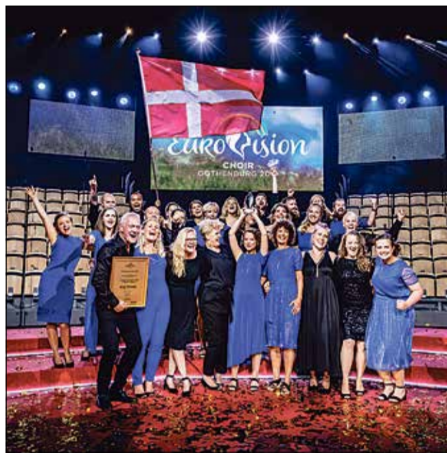
Ved sejren af Eurovision Choir i Göteborg