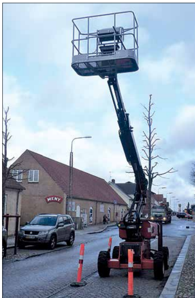
Så blev det sidste træ i Lindegade klippet.

Vi var jo mange, som fældede en tåre, da de smukke, skyggegivende 230 år gamle træer langs den historiske allé op til Brødremenighedens kirkegård sidste år blev fældet på grund af råd, huller og alderdom. Mange af træerne udgjorde faktisk en fare ifølge