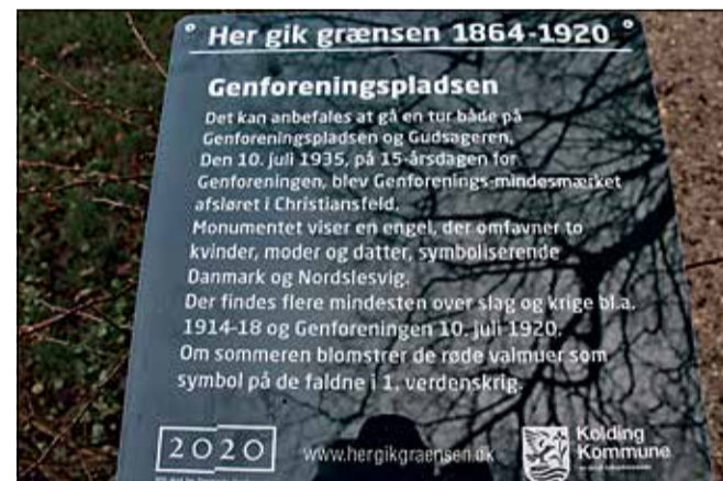
Tavlen på Genforeningspladsen.