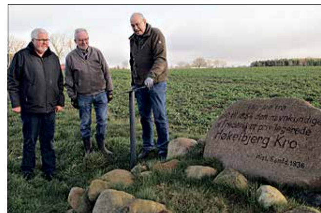
Næste tavle blev opsat ved mindestenen på Tingskovhedevej ved Gendarmstien.