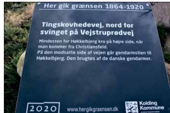
Denne tavle fortæller om den gamle Høkelbjerg Kro.