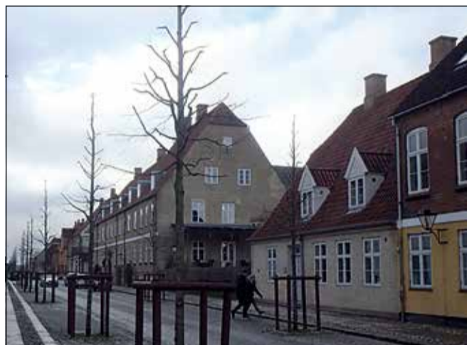
Takket være klipningen får man luft og udsyn i byen.