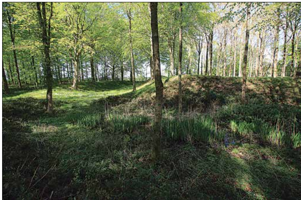
Set fra sydvest fås et godt indtryk af den brede voldgrav.

Denne gang fortælles om det store, flotte og velholdte Husvold et par kilometer sydvest for Sdr. Stenderup. Men bil tager turen cirka 25 minutter fra Christiansfeld via Taps og