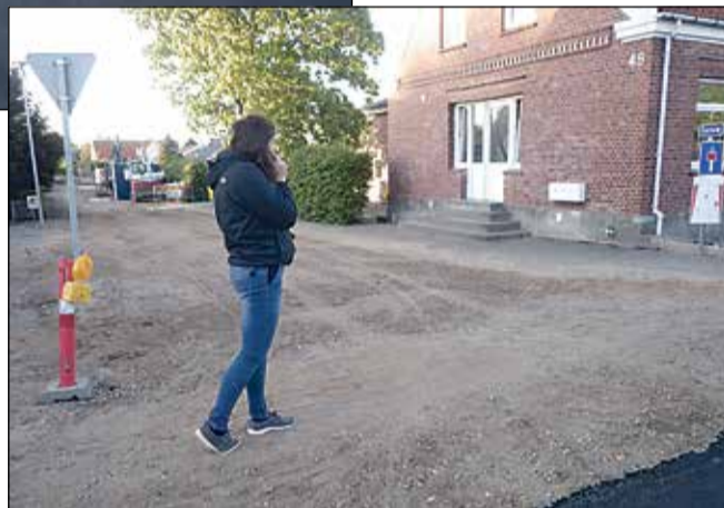
Renoveringsarbejdet er endnu i gang på den lille Genvej.