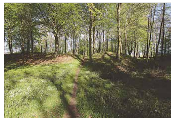
En i nyere tid anlagt sti fører op til voldstedet.