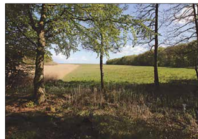
Før i tiden har Lillebælt nok været nærmere voldstedet.