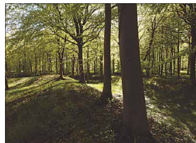
Husvold er med sit klippede græs nemt tilgængelig og præsenterer sig smukt med nyudsprungne bøge.