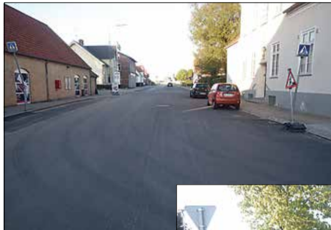
Lindegade med flot ny asfalt og fri vognbane.