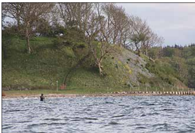
Det imponerende voldanlæg ved Hindsgavl.

1) Fæno Kalv. Fra stranden ved Borgsted er der direkte udsigt til den lille ubeboede ø, Fæno Kalv, hvor den norske konge Erik Præstehader i 1295 mødtes med Kong Erik Menved. Øen spillede også en rolle under svenskekrigen i 1658. Danskerne anlagde skanser på Fæno Kalv som forsvar mod Carl Gu-