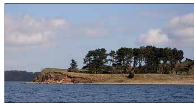
Den ubeboede Fæno Kalv set fra stranden ved Borgsted. Mellem fyrretræerne anes batterierne og skanserne.

lidt over en kilometer hen til, hvor en eng skræner ned mod stranden. Her markerer flotte løvtræer voldstedet, Skansen. Hold øje med den store gamle træstamme, der ligger parallelt med stranden direkte på skansen.