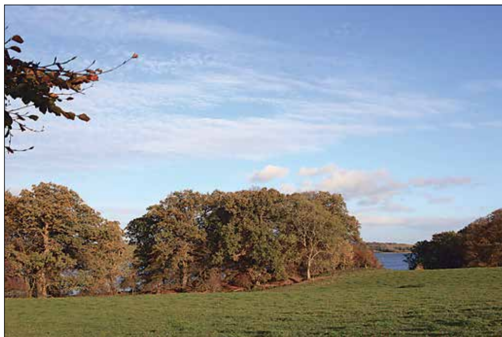
Skansen set oppe fra engen med Lillebælt.

De to anlæg, Borgsted og Skansen, er beskrevet i arkæolog på Museum Sønderjylland, Lennart S. Madsens bog »Voldsteder i Danmark - bind 2 - en vejviser«, der kan bestilles hjem fra biblioteket eller erhverves antikvarisk. Hindsgavl Slotsbanke er nærmere beskrevet i »Voldsteder i Danmark - Fyn og omliggende øer«.