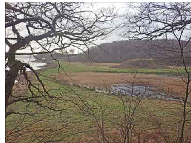
Høneborg Slotsbanke med den gamle landingplads, Hagenør i baggrunden.

Måske var det mellem Høneborg og Hindsgavl, at Christian den Anden 20 gange lod