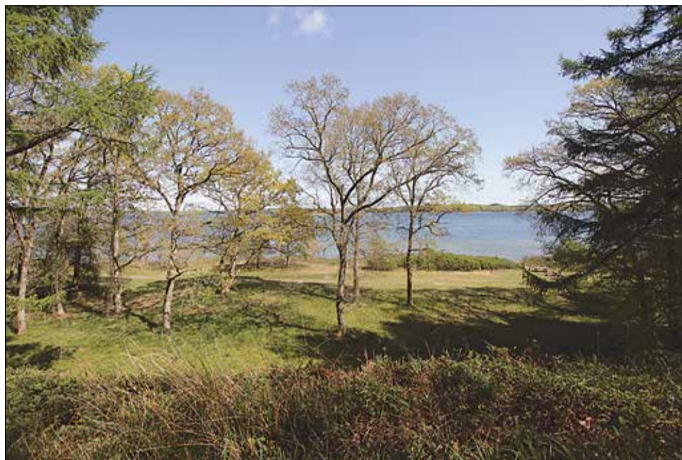
Udsigt oppe fra Borgsted Banke mod Fæno og Fyn.