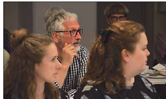
Spørgelysten var stor.