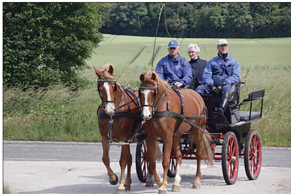
Vél ankommen hos Lillegaarden efter turen i sommerskoven.