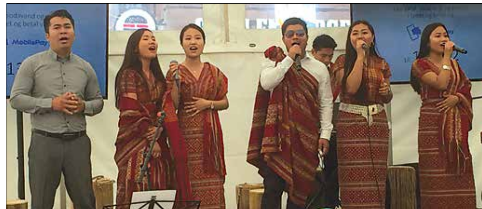
»Toner på tværs« fra det globale telt på Himmelske dage.