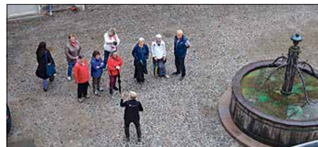
En af guiderne fortæller ved brønden bag Søstrehuset.