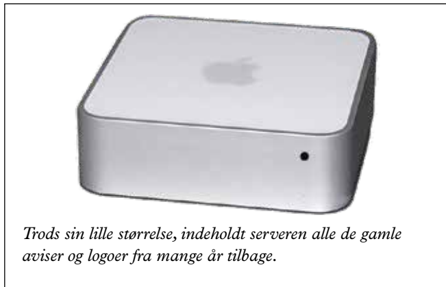
Trods sin lille størrelse, indeholdt serveren alle de gamle aviser og logoer fra mange år tilbage.