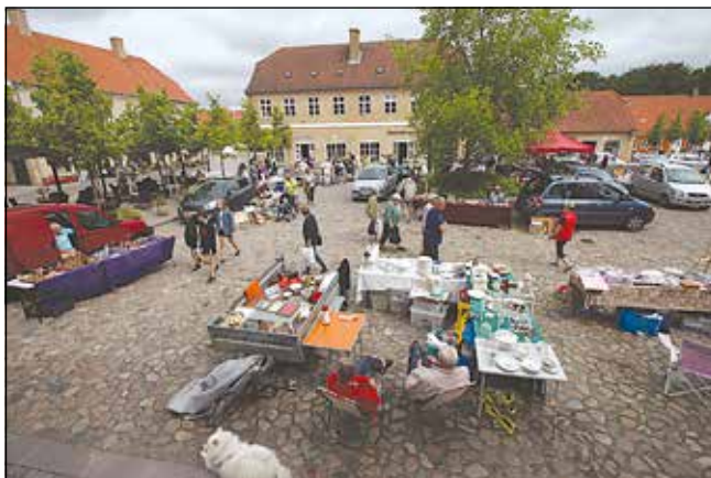
Lige fra starten summede Prætoriestorvet af liv, stemning og farve