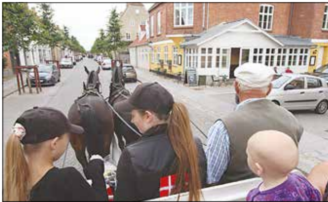
Løjerne startede klokken 10.30 med hestevognskørsel for både børn og voksne fra Meny og hen til Café Morgenstjernen og retur. På turen gennem byen var der slikposer til børnene fra Meny og hos Café Morgenstjernen kaffe til de voksne. Mange af børnene ville gerne klappe de smukke heste, som havde prøvet turen flere gange før.