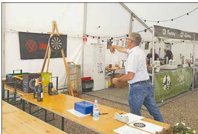
Søndag blev der også tid til Øl & Vin Dart