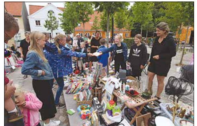
Der var masser af legetøj, tegneserier og meget andet spændende på børnenes egen stand, hvor de små købere og sælgere havde sjov med at lege »Bytte-bytte-købmand«.