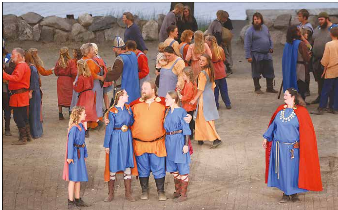
Vikingehøvdingen vender hjem fra et togt og vil have sin ældste datter gift