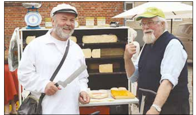
Fra Sommersted kom Elmegård Mejeri med deres udvalg af både milde og stærke ost og dem midt i imellem, som man kunne få smagsprøver på