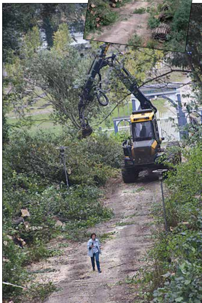
Træerne er fældet og skal nu transporteres bort.