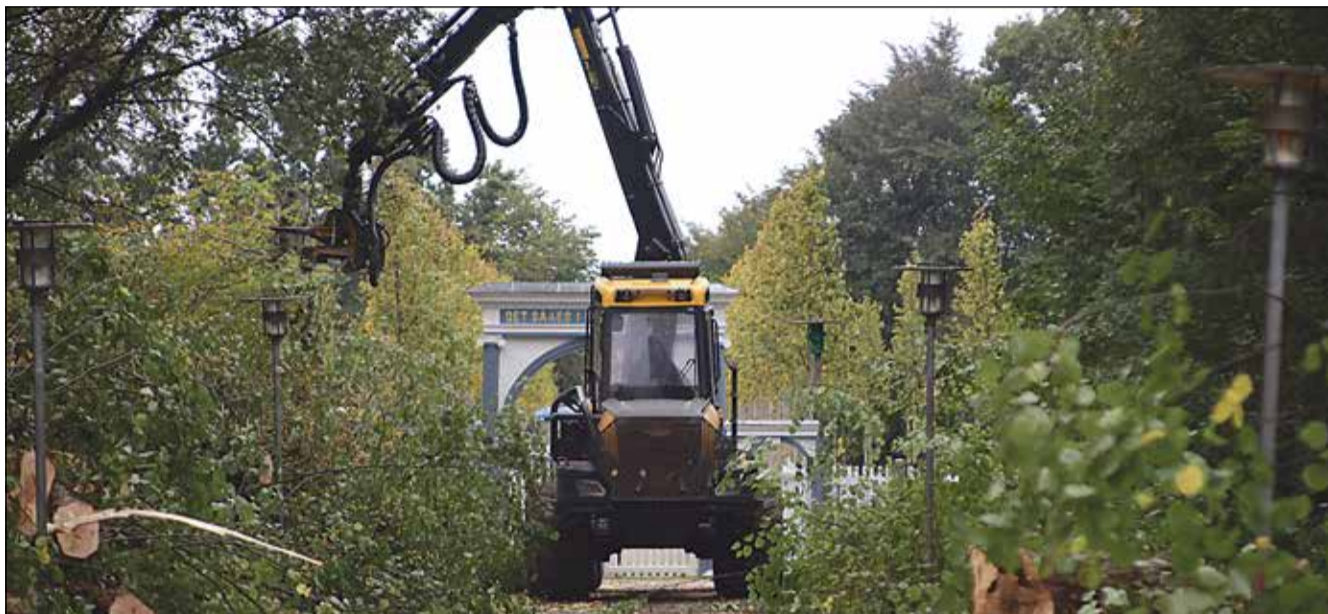
Der kan se voldsomt ud, når fældning foregår med store kraftige maskiner.