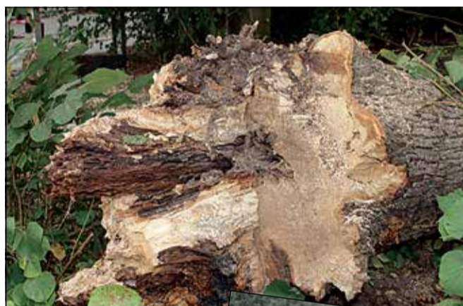
Mange af træerne var fulde af huller og råd.