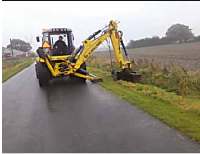
Så er de store maskiner i gang igen i Hjerndrup

Med penge tilovers fra sidste års pulje afholdes derfor en Informationsaften den 29. november i Hjerndrup Sognegård vedrørende penge i overskud fra borgerbudgettering 2016.