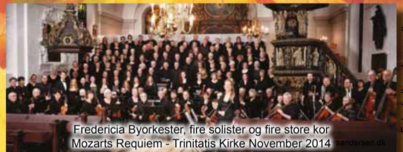
Fredericia Byorkester, fire solister og fire store kor Mozarts Requiem - Trinitatis Kirke November 2014 sandersen.dk