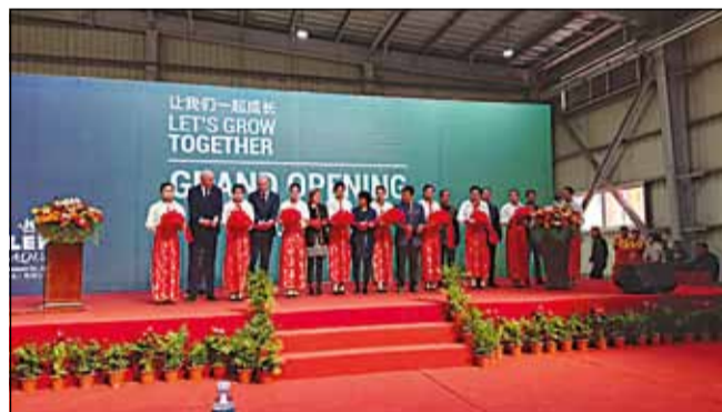
Det røde bånd bliver klippet i Aller Aqua Qingdao

Aller Aqua Group er en dansk gruppe med hovedkvarter i Christiansfeld. Firmaet producerer fiskefoder til mere end 60 lande verden over, i fabrikker i Danmark, Polen, Tyskland og Egypten, Zambia og Kina. Firmaet har inden for det seneste år fordoblet sin produktionskapacitet. Alt i alt har firmaet ca. 270 ansatte, og en omsætning i omegnen af 1 milliard DKK.