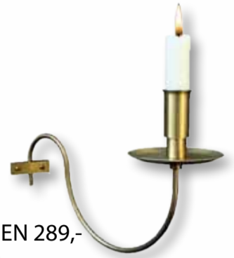
KARIBUSTAGEN 289,- Shop Karibu