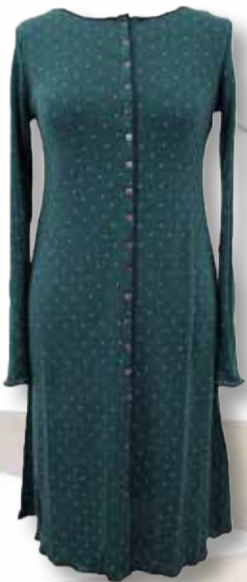
JALFE 311 KNAK KJOLE I ULD 1.095,- amanda-m

Køb dine julegaver i den hyggelige honningkageby, hvor et bredt udvalg af specialbutikker er klar til at yde dig en god service.