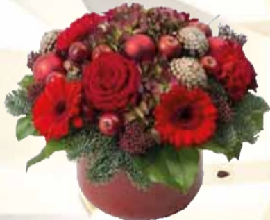
FLOT UDVALG I JULEBUKETTER DER SKABER JULEGLÆDE Anemonen