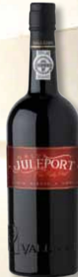
JULEPORTVIN 110,- Donslund Vine