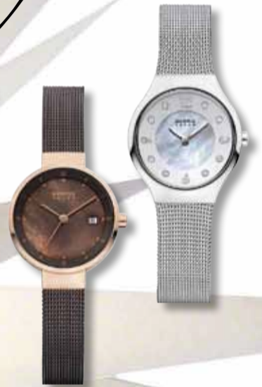
BERING SOLAR DAMEUR 1.599/1.499 Juel Nielsen Optik - Ure - Guld - Sølv