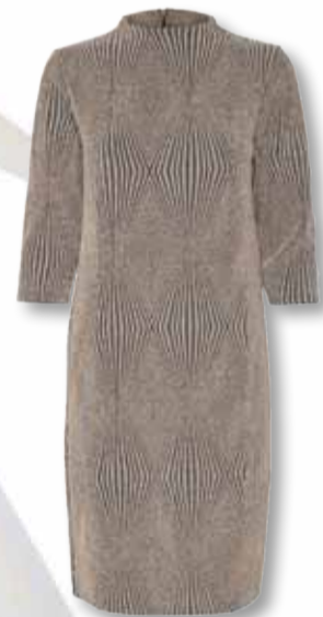
KAREN BY SIMONSEN KJOLE SMUKSAKK