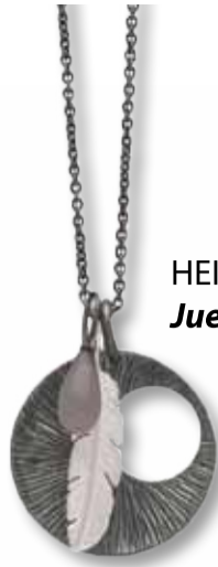
HEIRING SMYKKE 2.100,- Juel Nielsen Optik Ure Guld Sølv