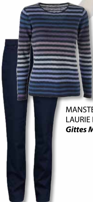
MANSTED BLUSE 749,- LAURIE BUKS 799,- Gittes Mode - Tøj fra str. 34-56