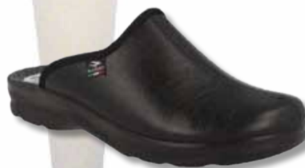
FLY FLOT 299,- Sønderhave Sko