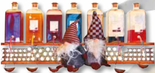
GARN - FROKOST - SPECIALITETER Det Gamle Apothek