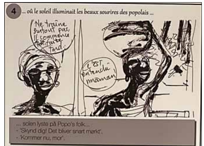
Nærfoto af tegneserien